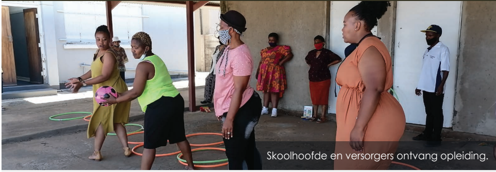
Skoolhoofde en versorgers ontvang opleiding.